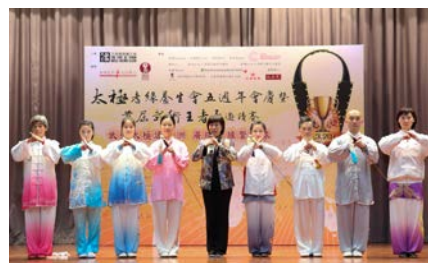
首屆「武術王者杯」八強運動員