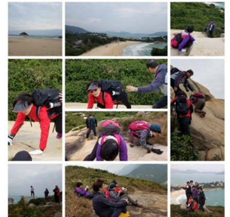
▲ 一二三四五六七，萬物生芽立春起；碰巧每月一聚的康健行山組在尹組長的帶領下，由石澳沙灘走起，爬上鶴嘴山（面對五星難度，大家變身蜘蛛俠安全完成挑戰）！