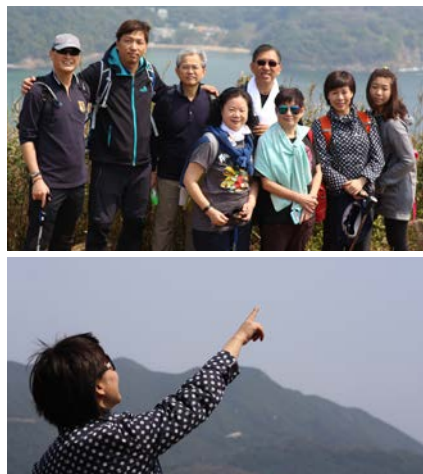
▲ 3月行山路線：清水灣道，登山往釣魚翁郊遊徑，沿大廟方向走，途徑田下山灣；而後到布袋澳用膳。

每個月的首個星期五的行山活動越來越受歡迎，最近有新加入的會友表示，如果路程適合，體能可應付的話，請假也會參與；能親親大自然，與天地清氣共融，是生活於石屎森林的都市人最大的享受！歡迎有興趣的會友參加，請在養生會群組報名。